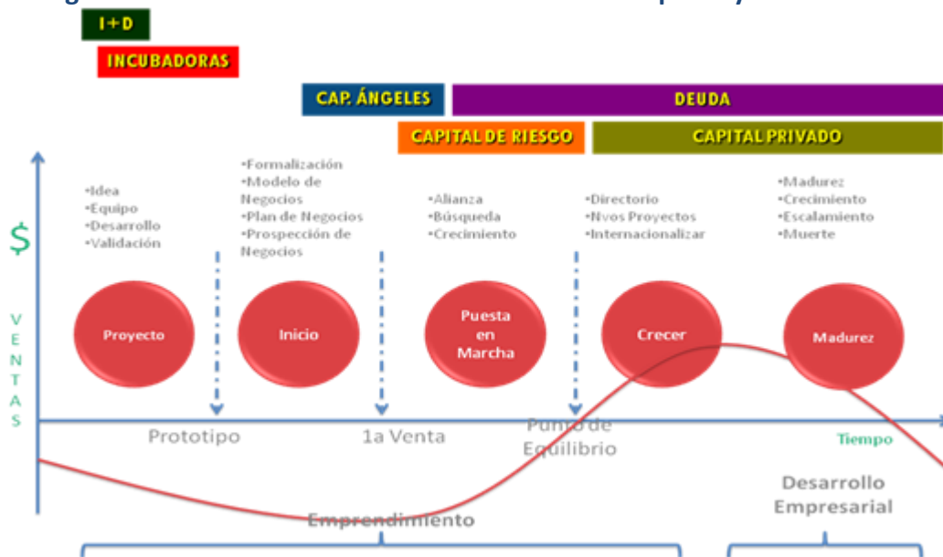
Figura n° 2: Relación entre el ciclo de vida de la empresa y financiamiento tipo

Cada una de las fases del ciclo de vida puede asociarse a un financiamiento “tipo”. Ello nos facilita la identificación de “la etapa de emprendimiento” como aquella que va desde la generación de la idea hasta su puesta en marcha (que se traduce en operación y funcionamiento regular del negocio). Así, el proceso de crecimiento y desarrollo de nuevos desafíos y madurez corresponden a la fase de desarrollo empresarial.