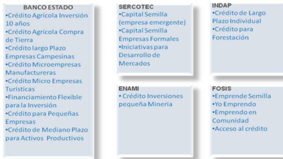
Figura n° 5: Otros programas ofrecidos por organizaciones públicas