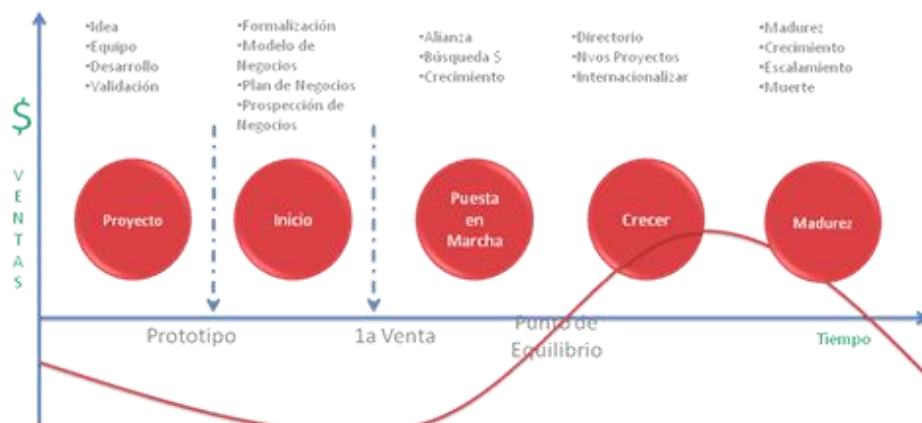
Figura n° 1: Ciclo de vida de una empresa

Un emprendimiento, empresa nueva o negocio, más allá del grado de sofisticación de la idea que lo genera, tiene una evolución natural que parte con la generación de la idea, su desarrollo y puesta en marcha, crecimiento y ajuste, madurez y en caso de fracaso, la muerte.