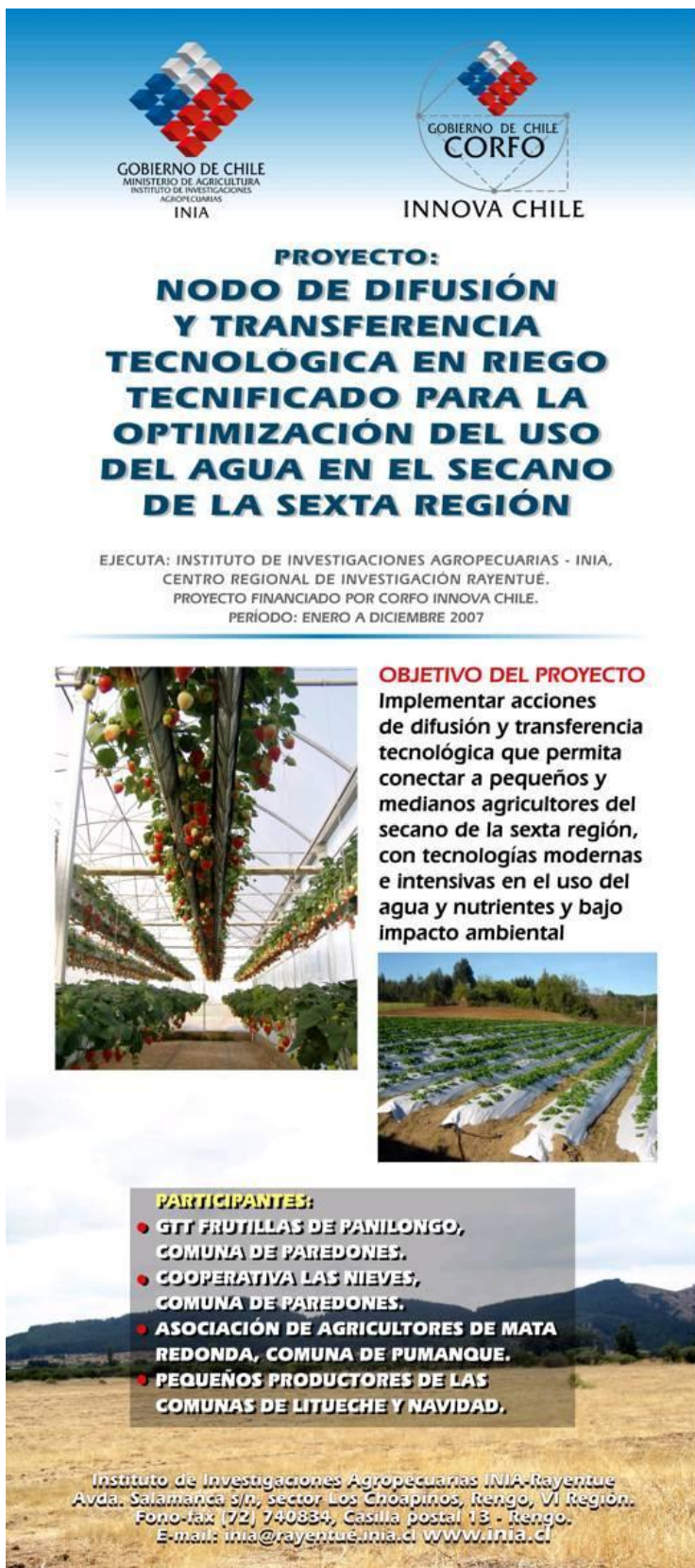
Figura 4. Pendón del Nodo de riego